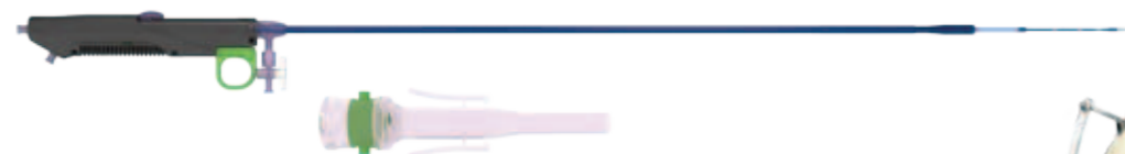
Ascendra2 Система доставки