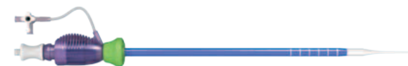
Ascendra2 Интродьюсер в наборе