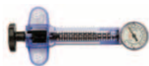
Atrion QL2530 Шприц-манометр