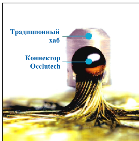
Коннектор Occlutech в сравнении с традиционным хабом

Компания Occlutech произвела массивные инвестиции в систему патентов. Технология индивидуального плетения была награждена Европейским и интернациональным патентами, что подтверждает инновационность и уникальность технологии. Компания Occlutech продолжает инвестировать значительную часть прибыли в разработку новых технологий и имеет в планах производство новой линейки перспективных продуктов.